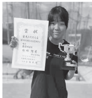
尾張選手権優秀選手