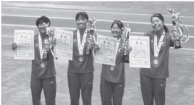
4 × 100mR 優勝・大会新・2連覇 (中京大中京)