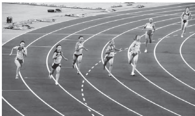
インターハイでの力走（左から2人目）

陸上競技に取り組む中で、悔しくて、楽しくて、幸せな経験を通じて、感謝を深く感じてきました。これからも、感謝の気持ちを忘れずに、私は走り続けます。